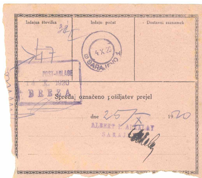
Rückseite einer Nachnahme-Postbegleitadresse, Sarajevo nach Breza, 4. 10. 1920